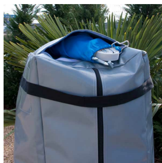
Sac de transport PVC ref 770006