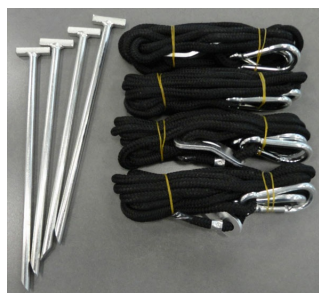
Kit d'arrimage ref 770002