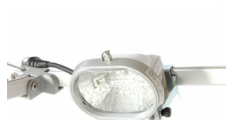
Spot 150 W ref 770003