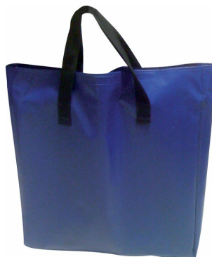
Sac à murs PVC ref 770007