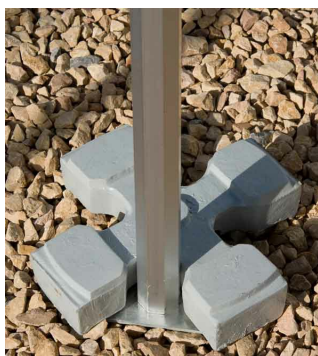
Lestage simple 15 kg - A l'unité ref 770001