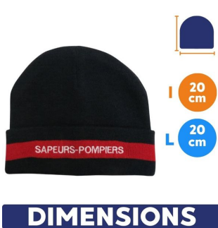
dimensions bonnet pompier