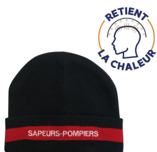
chaleur corporelle bonnet pompier