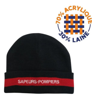
composition bonnet sapeur pompier