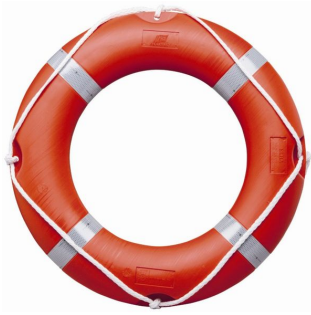
Bouée Couronne de sauvetage Solas - 73 cm