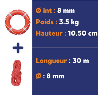
Bouée Couronne de sauvetage Solas - 73 cm