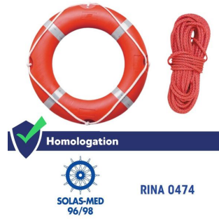
Bouée Couronne de sauvetage Solas - 73 cm