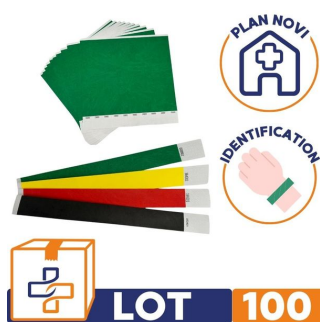
Bracelet d'identification de victime résistant