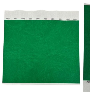
Bracelet d'identification de victime résistant