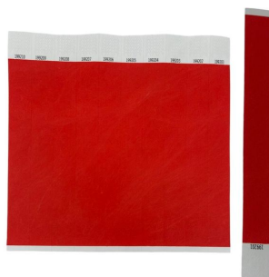
Bracelet d'identification de victime résistant