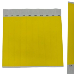
Bracelet d'identification de victime résistant