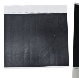
Bracelet d'identification de victime résistant