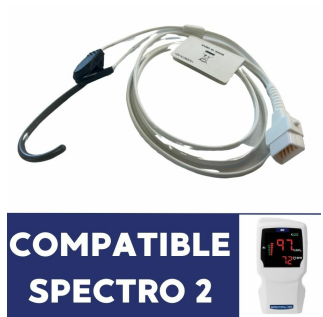
Capteur SPO2 réutilisable pour oxymètre de pouls