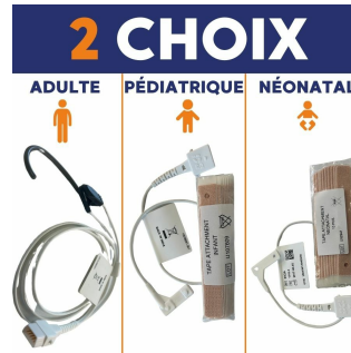
Capteur SPO2 réutilisable pour oxymètre de pouls