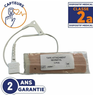
Capteur SPO2 réutilisable pour oxymètre de pouls