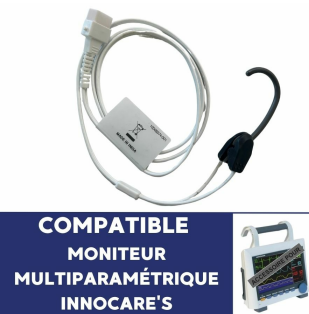
Capteur SPO2 réutilisable pour oxymètre de pouls