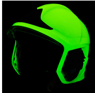
Casque pompier F1 photoluminescent