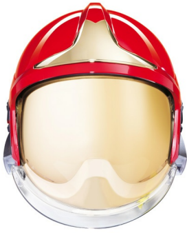
Casque pompier F1