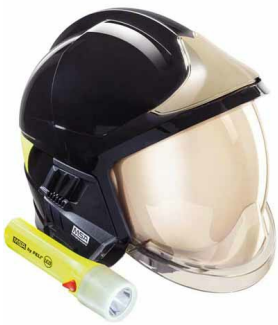
Casque F1 pompier métallisé