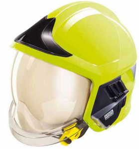
Casque F1 pompier jaune