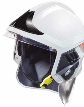
Casque F1 pompier blanc