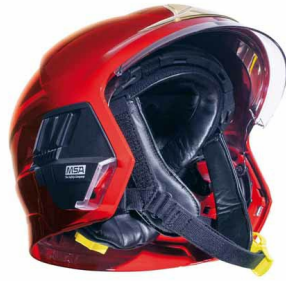
Casque F1 pompier rouge