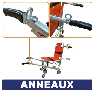
ANNEAUX chaise portoir avec anneaux pour harnais