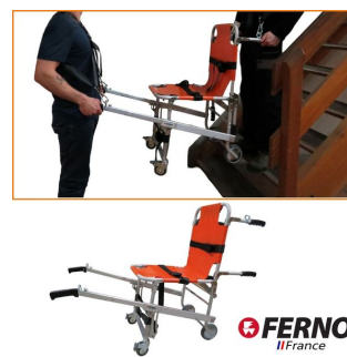
chaise portoir ferno avec anneaux pour harnais