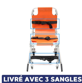
LIVRÉ AVEC 3 SANGLES chaise portoir ambulance avec 3 sangles