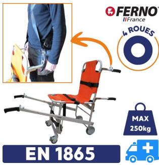
EN 1865 chaise portoir ambulance en 1865 avec 4 roues charge maximum 250kg avec anneaux pour harnais intégré