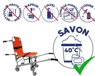
nettoyage de la chaise portoir