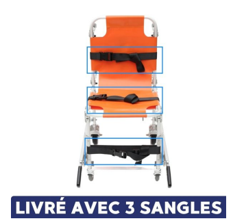
chaise portoir 3 sangles