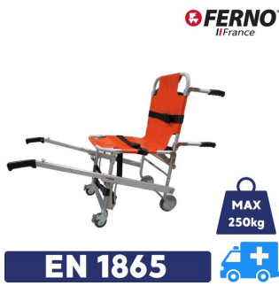
chaise portoir ambulance ferno en 1865 avec charge maximum 250kg