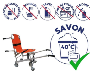
nettoyage de la chaise portoir