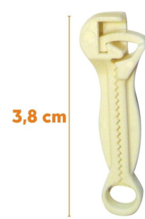
Clamp de Bahr anatomique stérile