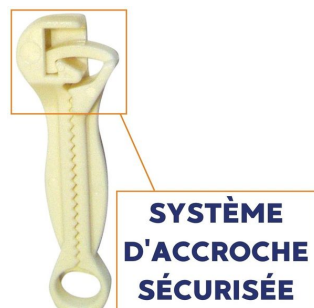
Clamp de Bahr anatomique stérile