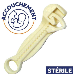
Clamp de Bahr anatomique stérile