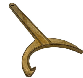
Clé tricoise multifonctions