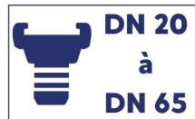
Clé tricoise multifonctions