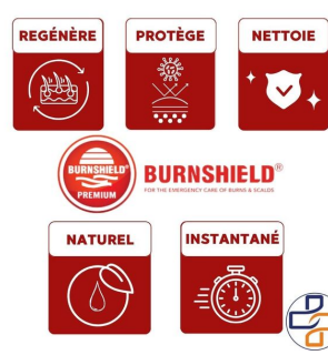
cas d'usage burnshield