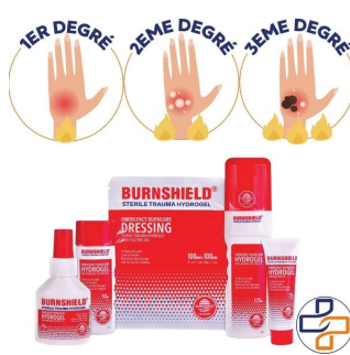
type de degré de brulure