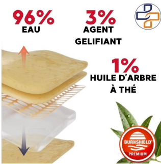
soin brulure 100% naturel