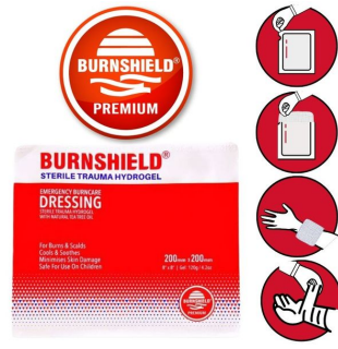
comment soigner une brulure