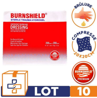
lot 10 soin brulure burnshield compresse soin brulure