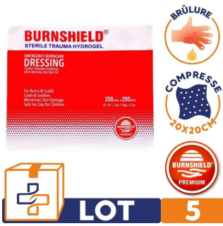
lot 5 compresse burnshield pour brulure soins infirmiers