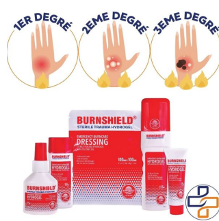
brulure 2eme degré soin