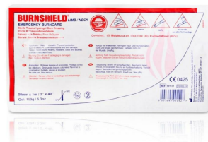
Compresse pour brulure hydrogel Burnshield