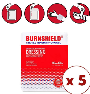
Compresse pour brulure hydrogel Burnshield