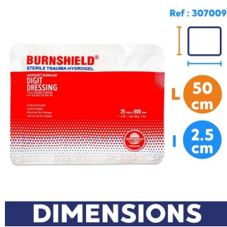
dimension compresse burnshield ref : 307009 disponible du smsp