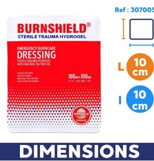
dimension compresse pour soin brulure burnshield