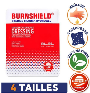
4 tailles de compresse burnshield composition 100% naturelle pour brulure