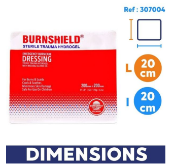
dimension burnshield pour soin brulure disponible sur smsp