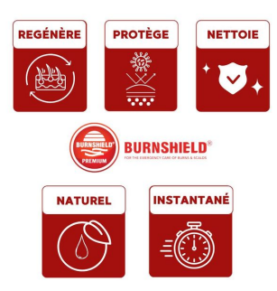
action bienfait soin brulure burnshield