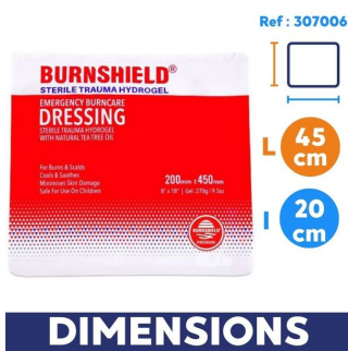
dimension burnshield compresse soin brulure