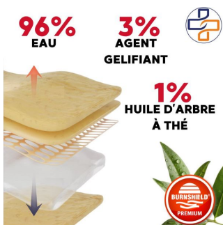
soin brulure 100% naturelle