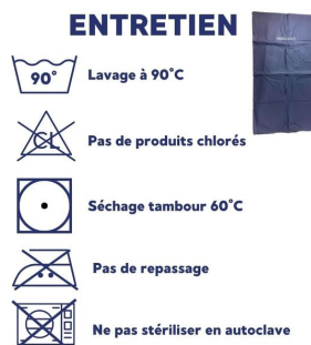
Couverture bactériostatique 60° cousue entretien