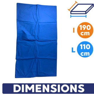
Couverture bactériostatique 90° soudée haute visibilité dimensions