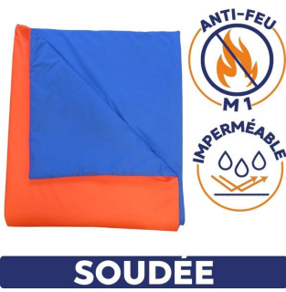
Couverture bactériostatique 90° soudée haute visibilité soudée