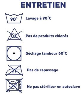
Couverture bactériostatique 90° soudée haute visibilité