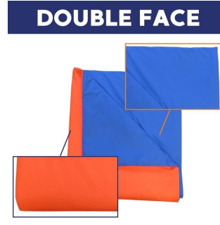
Couverture bactériostatique 90° soudée haute visibilité