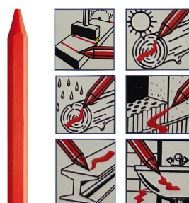
Craie de marquage rouge luminescente - Boite de 12