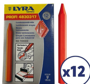
Craie de marquage rouge luminescente - Boite de 12