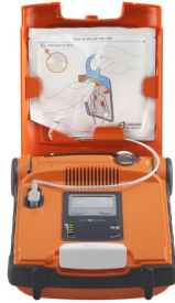
Défibrillateur Powerheart G5 Cardiac Science capot ouvert