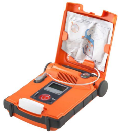
Défibrillateur Powerheart G5 Cardiac Science