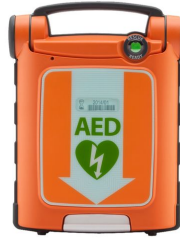
Défibrillateur Powerheart G5 Cardiac Science fermé