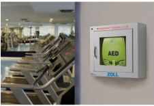
Défibrillateur Zoll aed Plus®