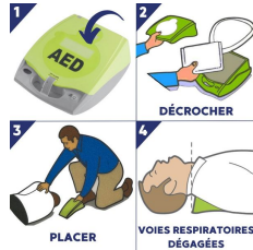
Défibrillateur Zoll aed Plus®