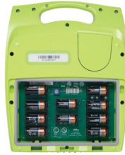
Défibrillateur Zoll aed Plus®