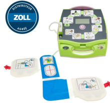
Défibrillateur Zoll aed Plus®