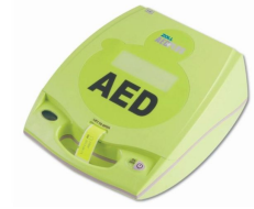
Défibrillateur Zoll aed Plus®