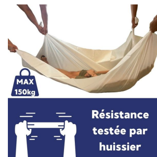
Drap jetable 60 gr de transfert - Carton de 50 - 145x200 cm