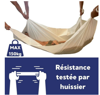
Drap jetable 60 gr de protection - 5 Cartons de 50 - 145x200 cm