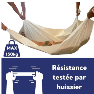
Drap jetable 65 gr - 5 Cartons de 50 - 150x220 cm