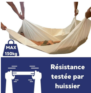
Drap jetable 65 gr - 5 Cartons de 50 - 150x220 cm