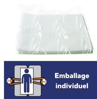
Drap jetable 65 gr - 5 Cartons de 50 - 150x220 cm Drap jetable 65 gr - 5 Cartons de 50 - 150x220 cm Drap jetable 65 gr - 5 Cartons de 50 - 150x220 cm