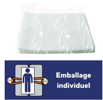
Drap jetable 65 gr - 5 Cartons de 50 - 150x220 cm Drap jetable 65 gr - 5 Cartons de 50 - 150x220 cm Drap jetable 65 gr - 5 Cartons de 50 - 150x220 cm