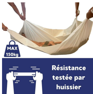
Drap jetable 65 gr - 5 Cartons de 50 - 150x220 cm