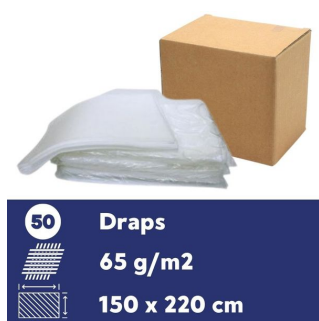
Drap jetable 65 gr - Carton de 50 - 150x220 cm