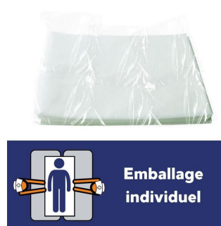
Drap jetable 65 gr - Carton de 50 - 150x220 cm