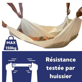
Drap jetable 65 gr - Carton de 50 - 150x220 cm