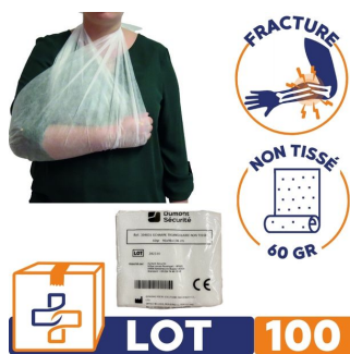
Echarpe triangulaire d'immobilisation - non-tissé 60 gr Lot de 100