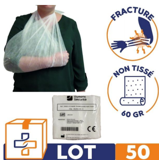
Echarpe triangulaire d'immobilisation - non-tissé 60 gr Lot de 50