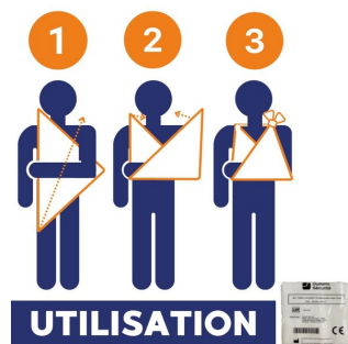
Echarpe triangulaire d'immobilisation - non-tissé 60 gr Lot de 50