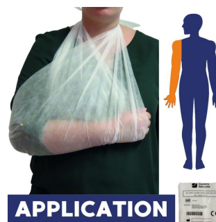
echarpe de l'épaule