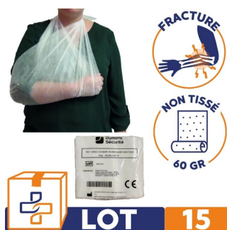
lot de 15 écharpe contre écharpe non tissé pour fracture