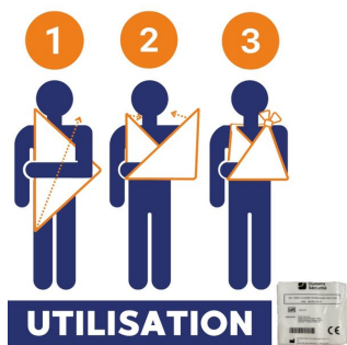
comment installer une écharpe triangulaire