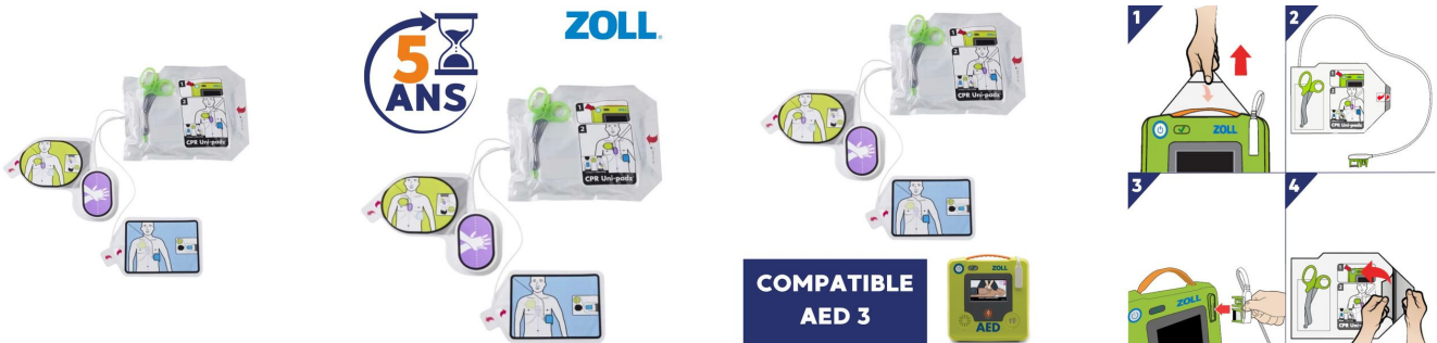
Électrodes CPR UNI PADZ AED 3 Électrodes CPR UNI PADZ AED 3 Électrodes CPR UNI PADZ AED 3