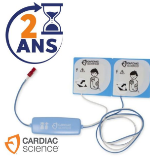
Electrode défibrillateur enfant Powerheart G3