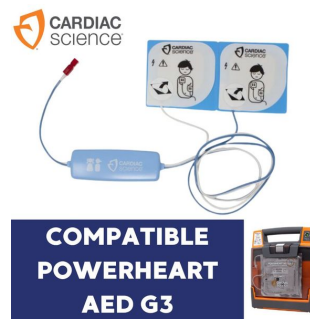
Electrode défibrillateur enfant Powerheart G3