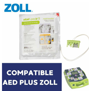
Electrode défibrillateur adulte Stat Padz II aed plus Zoll