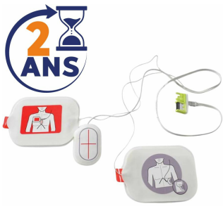
Electrode défibrillateur adulte Stat Padz II aed plus Zoll