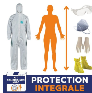
protection du corps intégrale avec pack smsp protection hazmat