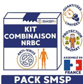
pack smsp assemblé en France protection hazmat combinaison nrbc