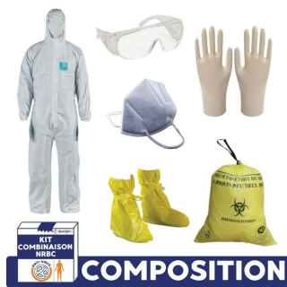
composition pack smsp protection hazmat combinaison nrbc