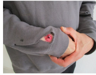
Plaie filet avec clou