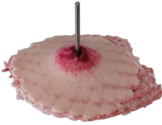
Plaie filet avec clou