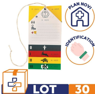
lot de 30 Fiche de tri multi-victimes plan novi smv