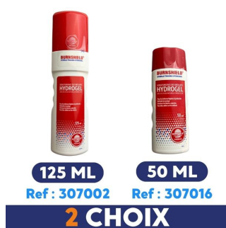
contenance flacon gel soin brulure 125ml et 50ml