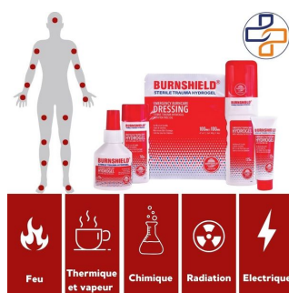
acheter soin brulure