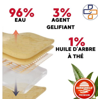
soin brulure 100% naturel