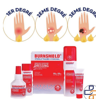
degré brulure burnshield