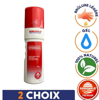
2 choix de flacon gel pour soin brulure 100%naturel