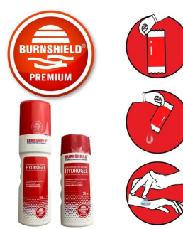
acheter gamme soin brulure