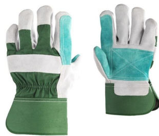
gants de manutention