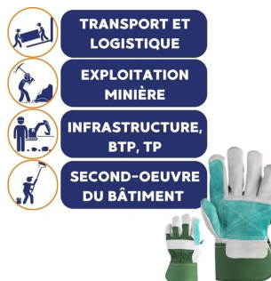
gant de manutention