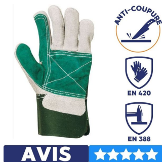
gant de manutention