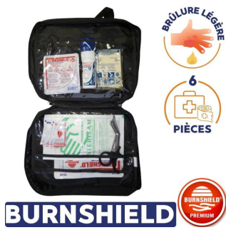
Kit brûlure premium Premier secours