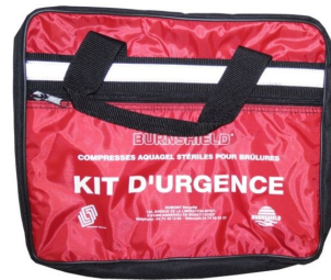
Kit brûlure premium Premier secours