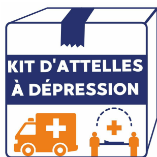
attelle à dépression pompier