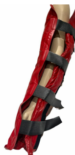
attelles à dépression