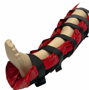
attelles à dépression