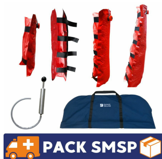
attelles à dépression