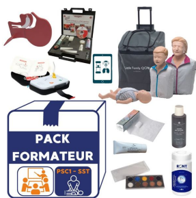
Kit de formation PSC1 - SST