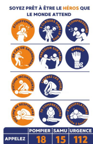
Kit de formation PSC1 - SST