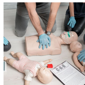
Kit de formation PSC1 - SST