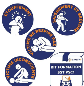
Kit de formation PSC1 - SST