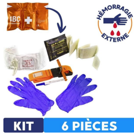
kit hémorragie externe composé de 6 pièces