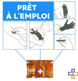
kit hémorragie externe prêt à l'emploi