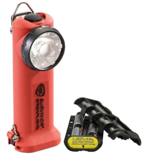
Lampe coudée Survivor LED