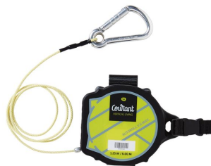
Liaison personnelle Autoroll V6 Max