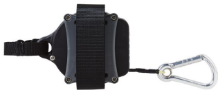
Liaison personnelle Autoroll V6 Max