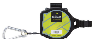
Liaison personnelle Autoroll V6 Max