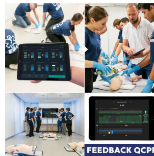
Lot de 3 mannequins QCPR - Pack rcp famille Laerdal