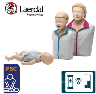
Lot de 3 mannequins QCPR - Pack rcp famille Laerdal