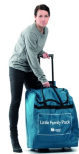
Lot de 3 mannequins QCPR - Pack rcp famille Laerdal