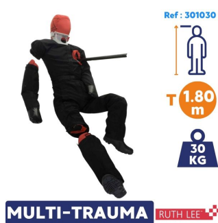
MULTI-TRAUMA RUTH LEE mannequin sauvetage pompier multi-traumatismes Adulte léger 30kg