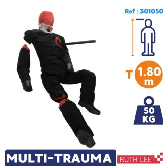
MULTI-TRAUMA RUTH LEE ruth lee mannequin sauvetage pompier multi-traumatismes Adulte standard 50kg