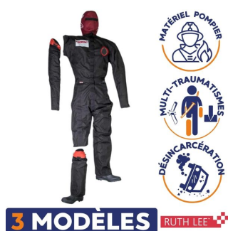
3 MODÈLES RUTH LEE 3 modèles de ruth lee mannequin entrainement pompier multi-traumatisme pour désincarcération