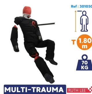
MULTI-TRAUMA RUTH LEE mannequin entrainement pompier Adulte lourd 70kg