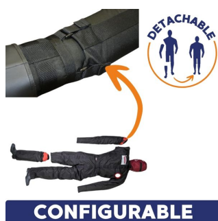
CONFIGURABLE mannequin sauvetage pompier détachable et configurable pour exercice évacuation incendie