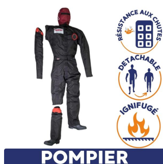
POMPIER ruth lee mannequin pompier détachable ignifugé et résistant aux chutes