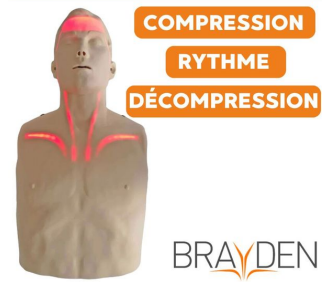
Mannequin secourisme lumineux Brayden à LED rouge