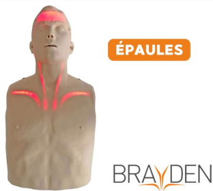
Mannequin secourisme lumineux Brayden à LED rouge