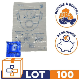
Masque bouche à bouche de poche Lot de 100