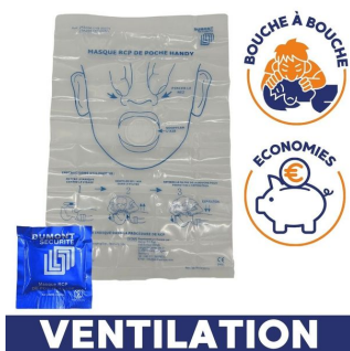
Masque bouche à bouche éco