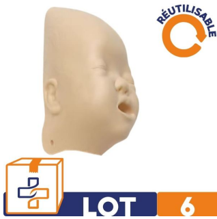
lot de 6 Peau de visage pour mannequin Baby Anne laerdal