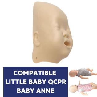
peau visage compatibilité mannequin Laerdal