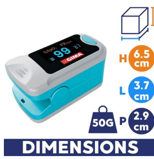
Dimensions et poids de l'Oxymètre de pouls Gima Oxy 3 - SMSP