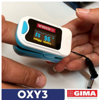
oxymètre de pouls gima modèle oxy3 - Infos, prix et disponibilités sur SMSP