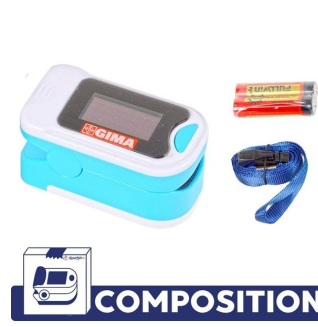
Composition oxymètre de pouls Gima Oxy 3 - SMSP Ref 200002