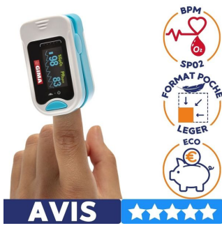
oxymètre de pouls avis 5 étoiles pour diagnostic médical résistant au froid et à la chaleur