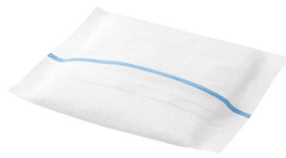
pansement absorbant stérile