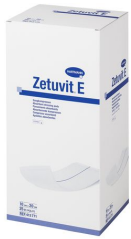
pansement absorbant stérile zetuvite hartmann