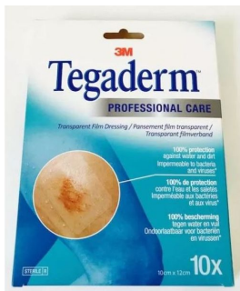
Pansement stérile adhésif Tegaderm transparent 10 x 12cm - Lot de 10