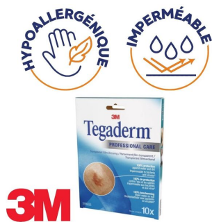
Pansement stérile adhésif Tegaderm transparent 10 x 12cm - Lot de 10