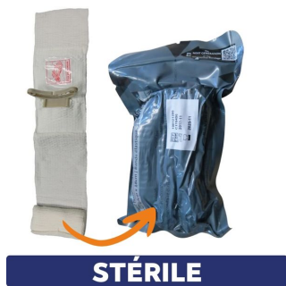
conditionnement du pansement israelien compressif stérile