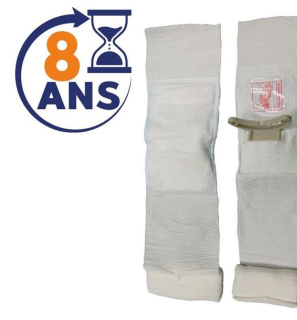
Pansement israélien compressif stérile First Care Blanc