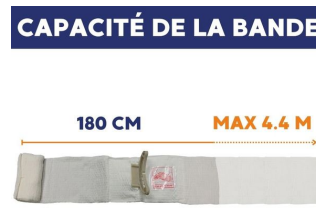
Pansement israélien compressif stérile First Care Blanc