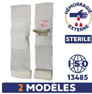
Pansement israelien compressif stérile First Care Blanc