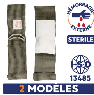
pansement compressif version militaire stérile pour hémorragie externe certifié iso13485 disponibles en 2 modèles