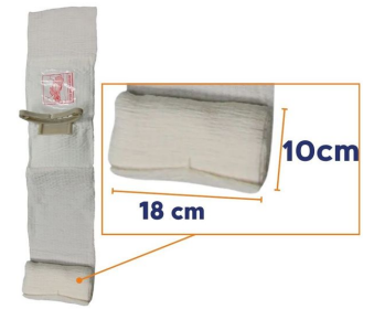
Pansement israélien compressif stérile First Care Blanc